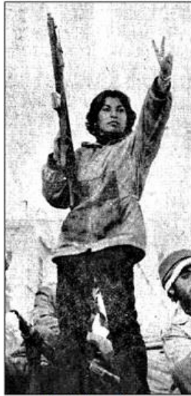
چریک در قیام 57