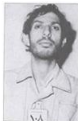
در زندان شاه